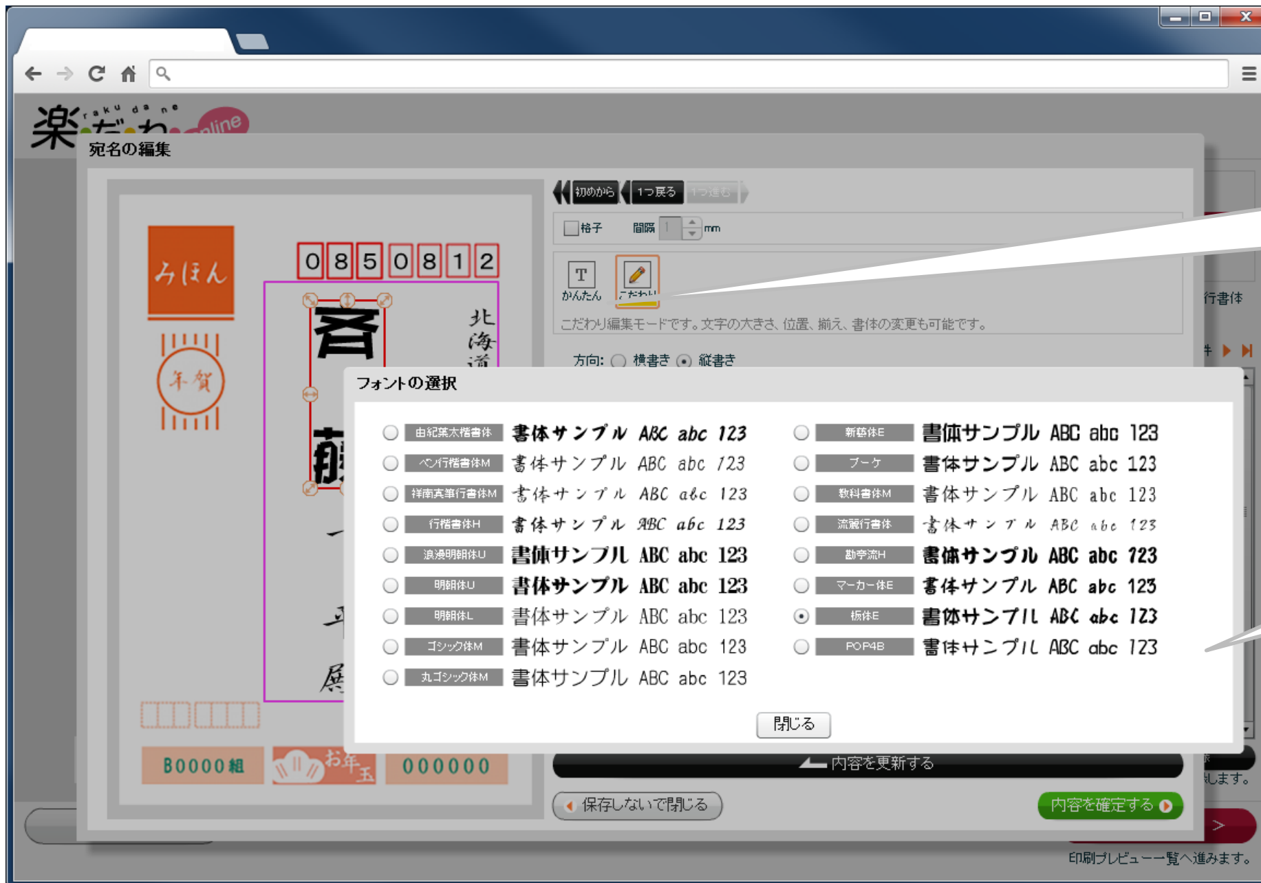
【こだわり編集画面】